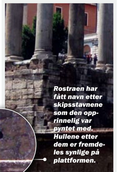
Rostraen har fått navn etter skipsstavnene som den opprinnelig var pyntet med. Hullene etter dem er fremdeles synlige på plattformen.